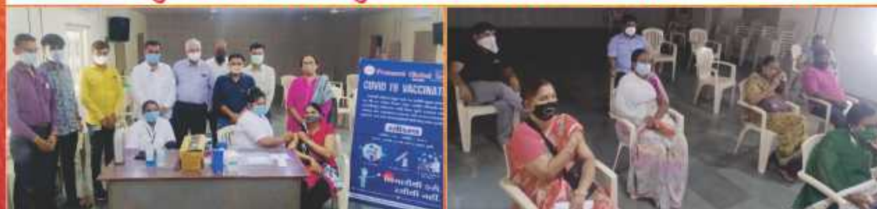
પ્રણામી ગ્લોબલ સ્કૂલમાં કોરોના વેક્સીનેશનકા કાર્યક્રમ (દિનાંક - ૦૮/૦૪/૨૦૨૧)