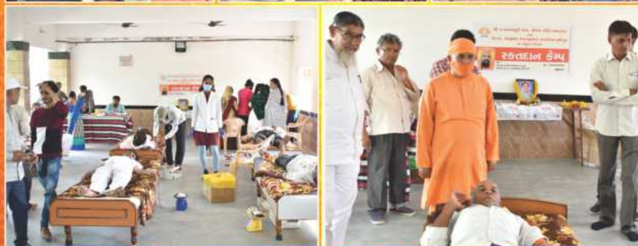
હર્ષદપુરમાં શ્રી ૫ નવતનપુરી ધામ કી ઓર સે રક્તદાન કેમ્પ સમ્પન્ન